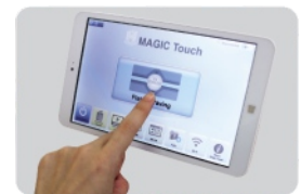
Control y uso desde la tableta.