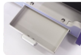
Bandeja de herramientas.