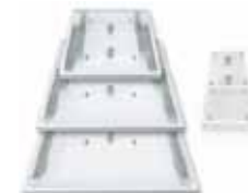
Bastidor Extra de regalo