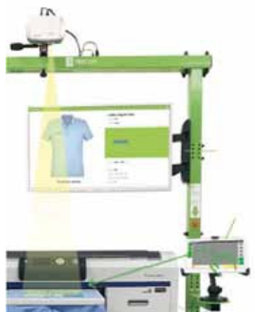
Tree EPS Sistema de Posicionamiento