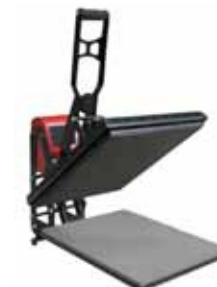
Plancha Max-Hover Especial DTG